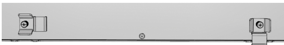
Sicherung geöffnet / Safety catch opened

Always secure the accessory with a suitable safety cable from falling when the primary mounting method fails!